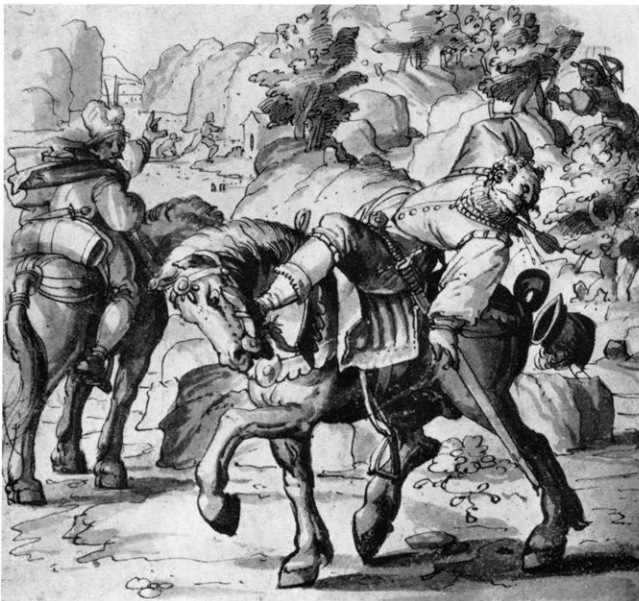
Abbildung 3 b