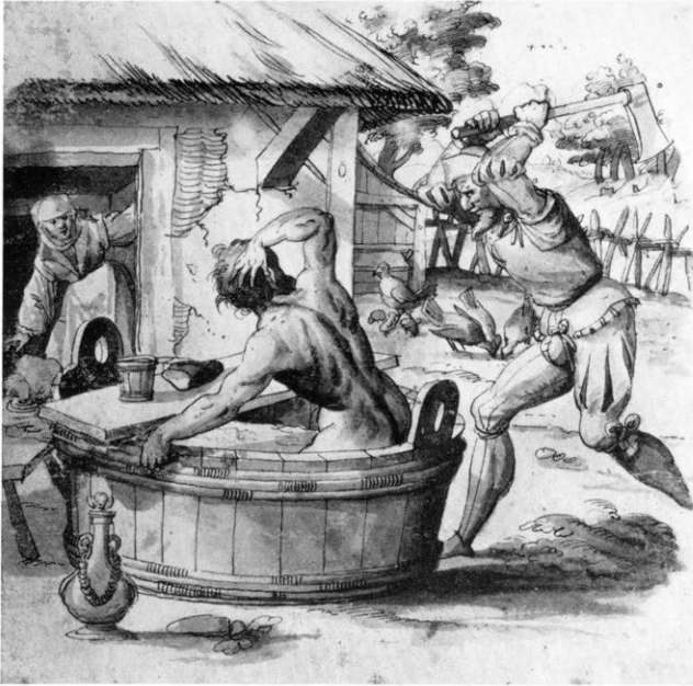
Abbildung 3 a