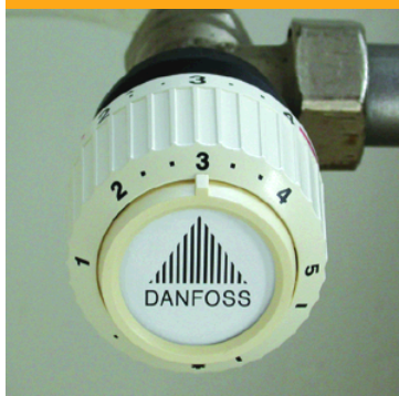
Thermostat richtig einstellen